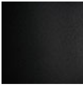
GFM73 goffrato nero